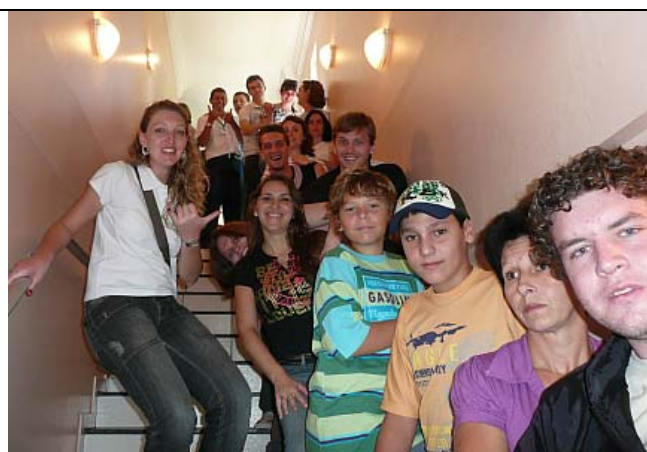
Hora do Almoço