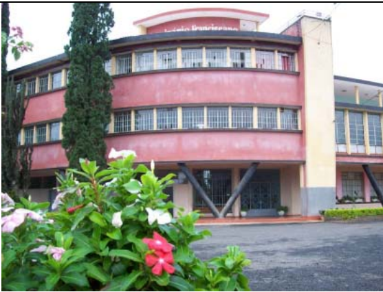
Seminário São João Batista - Luzerna