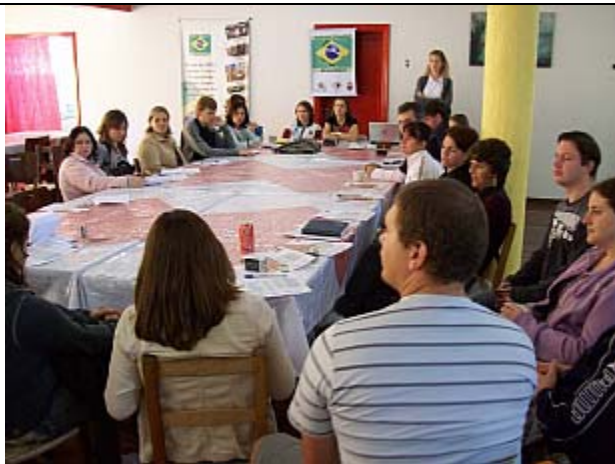
Hora dos Trabalhos