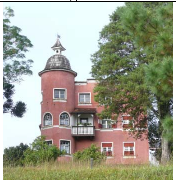
Castelinho Museu Municipal Ministro Andreas Thaler