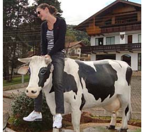
e a foto com a vaquinha...