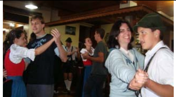
Participação da Dança Austríaca