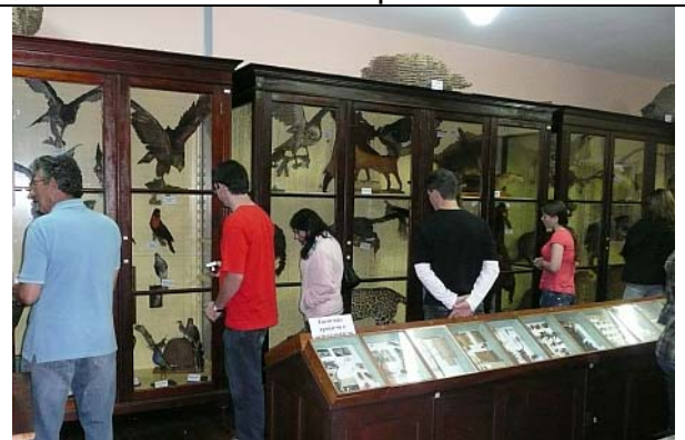
Museu Frei Miguel