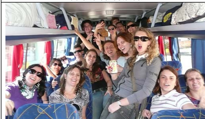
Turma do ônibus