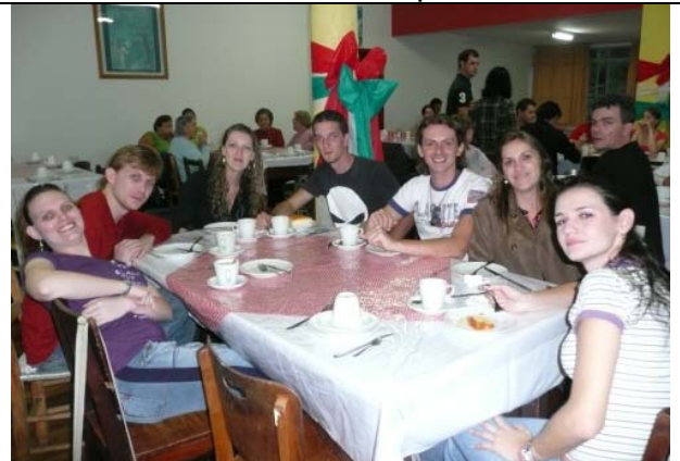
Café Colonial oferecido pelo CT de Luzerna