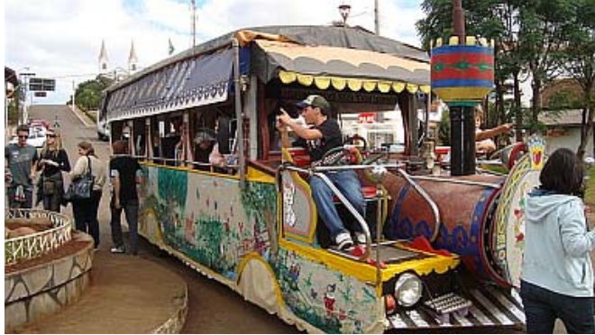
Passeio de Trenzinho