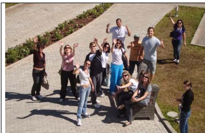
do alto da estátua