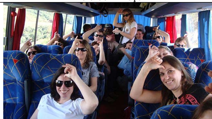
Momento de Loucura