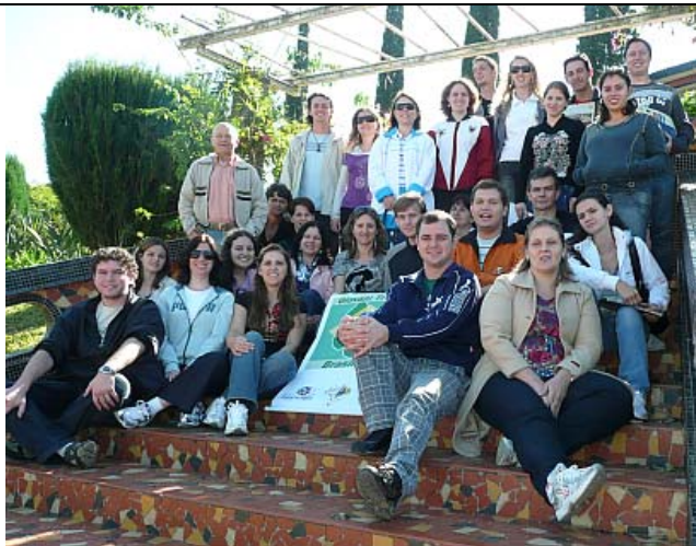
Fim da Reunião