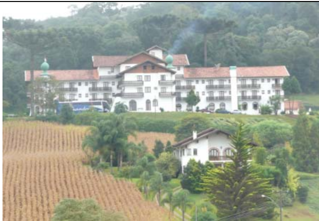
Treze Tílias Park Hotel