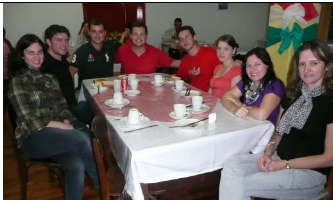
Café Colonial oferecido pelo CT de Luzerna