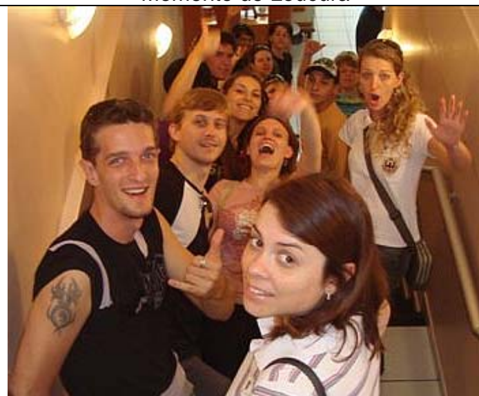
E ATÉ A PRÓXIMA!!!!