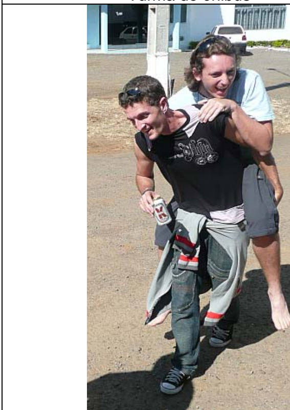
Momento de Solidariedade