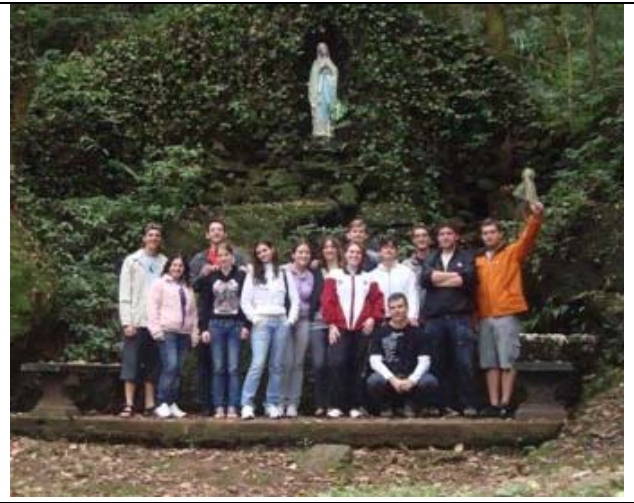
Visita à Gruta